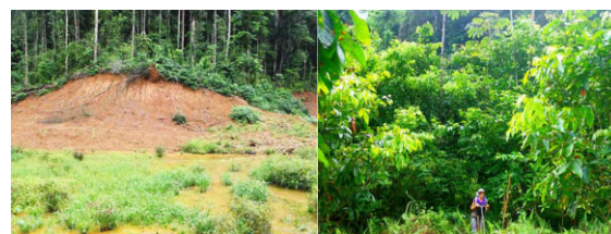
Рис. 2. Фотография до (слева) и после трех лет восстановления растительного покрова (справа) с помощью Ингасом в Пактолесе [16]

Качественная рекультивация направлена на восстановление исходных функций и структуры экосистемы, что обеспечивает ее полное восстановление (рис. 2 [16]).