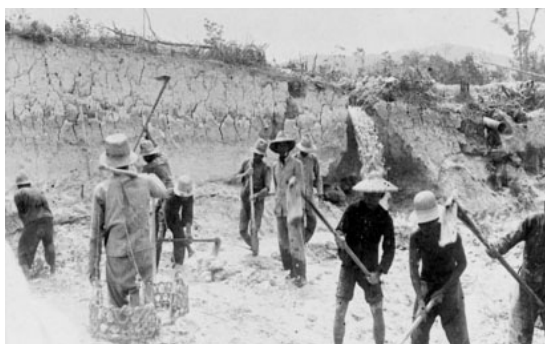
Рис. 1. Добыча полезных ископаемых в долине Бангка в Индонезии (1930) [14]

Воздействие горнодобывающей промышленности требует адекватных мер для минимизации его пагубных негативных последствий. В ряде регионов (Новая Каледония, Южная Африка, Индонезия, Испания, Франция, Австралия и др.) добыча полезных ископаемых привела к нарушению больших площадей земель (особенно в долинах и ниже по течению от объекта горной добычи) и загрязнению больших площадей земель, поверхностных и грунтовых вод токсичными веществами (рис. 1).