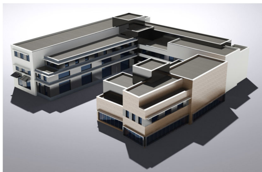
Рис. 2. Проект здания, вид сверху

Рис. 1, 2, представленные в ПО AutoCAD Civil 3D, демонстрируют реализацию данной модели, отражая ее геометрические и пространственные характеристики. Это служит визуализацией итогов работы и подтверждает практическую применимость результатов. На основе разработанной модели будет проведен анализ данных, что позволит не только оценить применимость технологий, но и сделать выводы о возможности дальнейшего использования подобных решений в контексте «умного города».