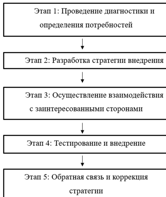
Рисунок 5. Эффективные решения для успешной реализации концепции «умного города»

Учитывая эти вызовы, необходимо искать эффективные решения для успешной реализации концепции умного города (рис. 5).